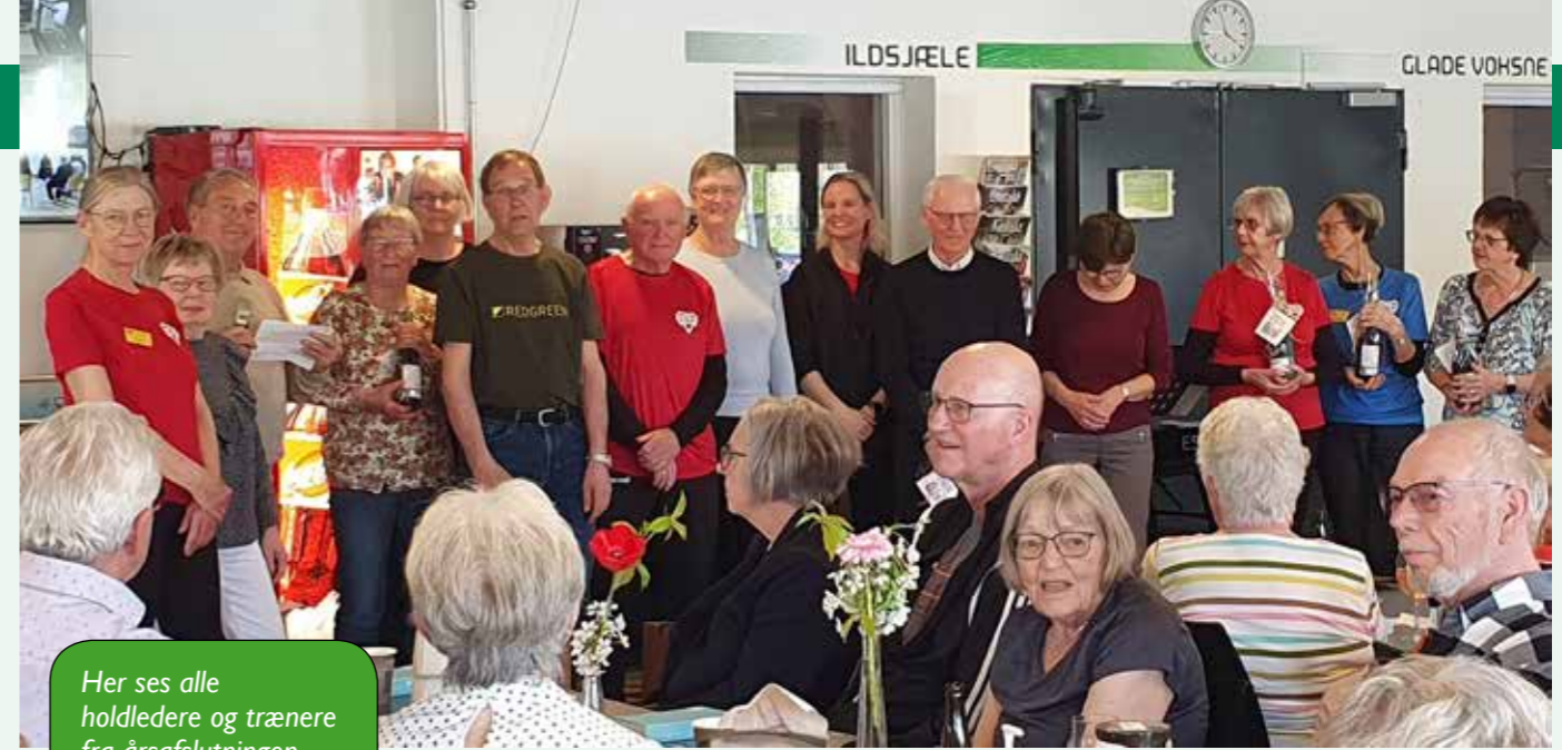
Her ses alle holdledere og trænere fra årsafslutningen

om spillereglerne. Det bliver spændende at se, om spillet falder i medlemmernes smag.