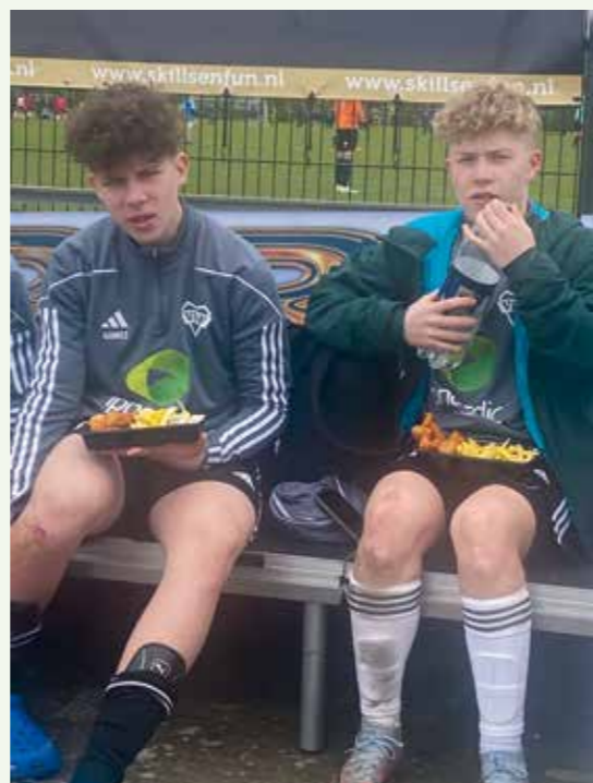
Fish 'n' chips er den perfekte afslutning på en lang dag med kampe.

åbningsceremonien afspillede den engelske nationalme-lodi samtidig med, at de højeste det tyske flag. Vi bed dog ikke mærke i større repressalier som følge af hændelsen og det er i skrivende stund endnu uvist, om der have været indkaldt til krisemøder på EU-niveau.