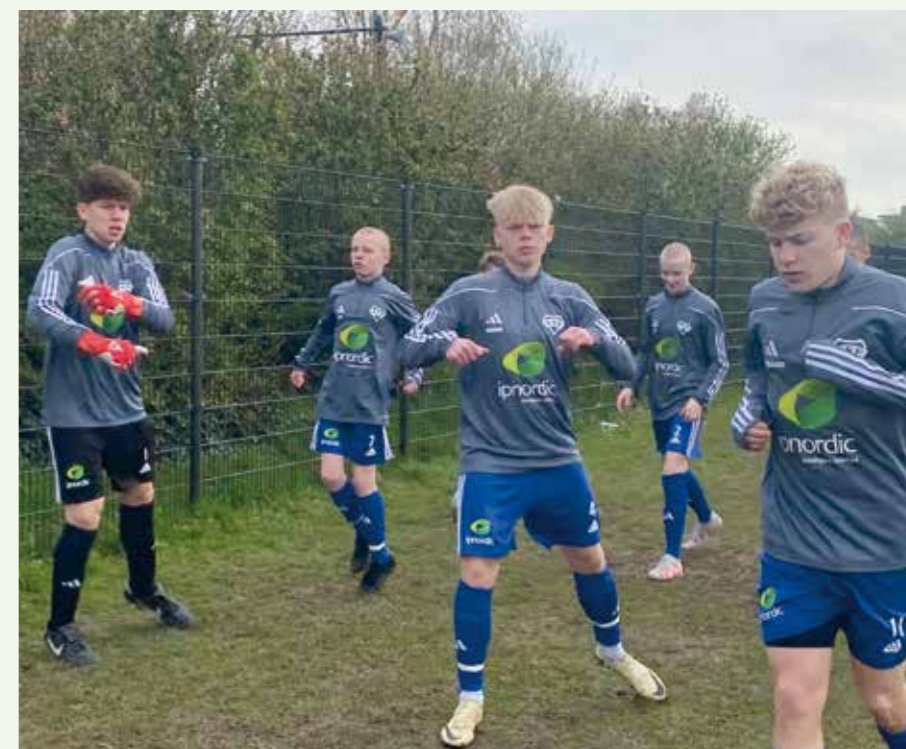
F – Opvarmning skal der til.