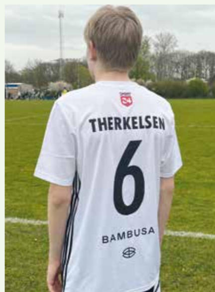
Inden tur blev der solgt strømper fra Bambusa, der kvitterede med et flot sponsorat