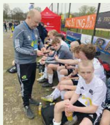
Resultaterne tjekkes for at blive kloge på, hvem der bliver næste modstander.