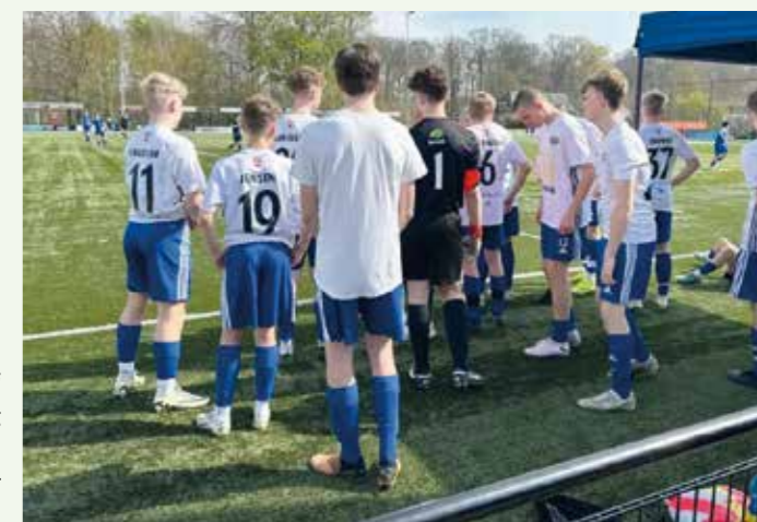
Trøjerne fra vores sponsor - McDonald's i Vinding blev luftet flittigt og fik mere end en misundelig kommentar fra modstanderne.