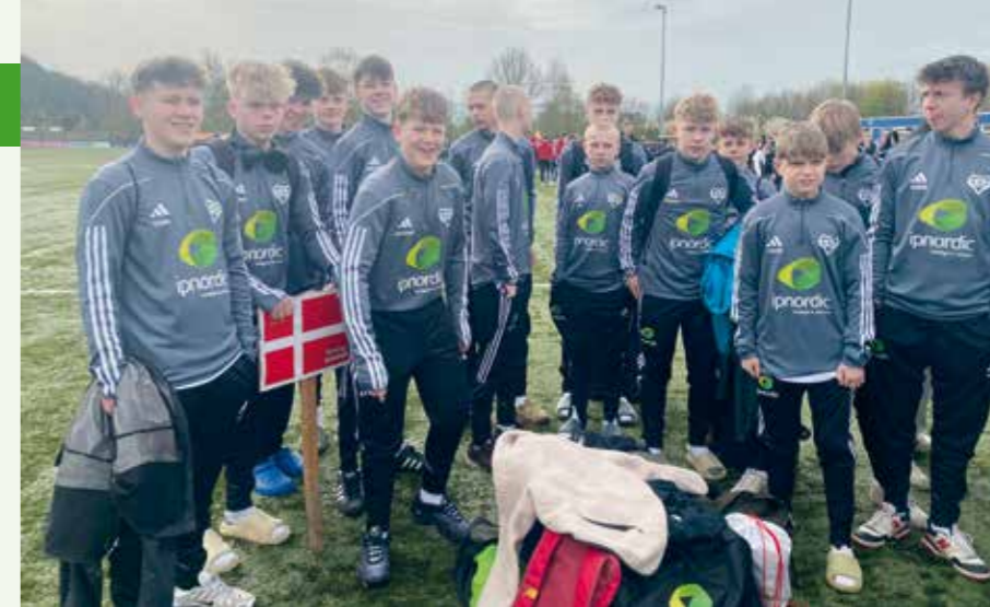
I træningsdragter fra vores sponsor, telefonivirksomheden IP Nordic