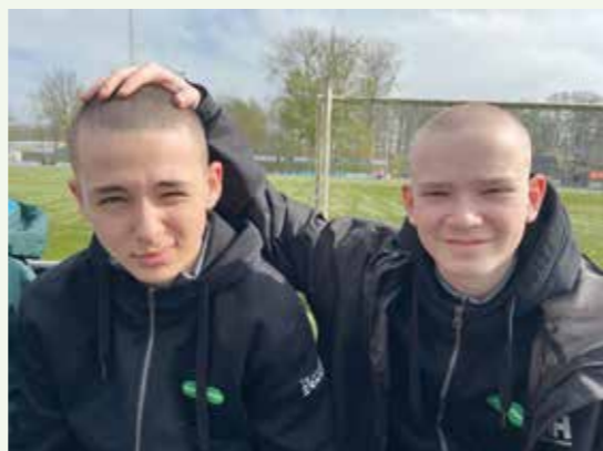
Louis Nielsen i Kolding havde beriget os med flotte, flotte hoodies, der stadig bliver båret med stolthed i både skole og til kampe.

Nyt udebanesæt fra IP Nordic – vi ser godt ud i blå!