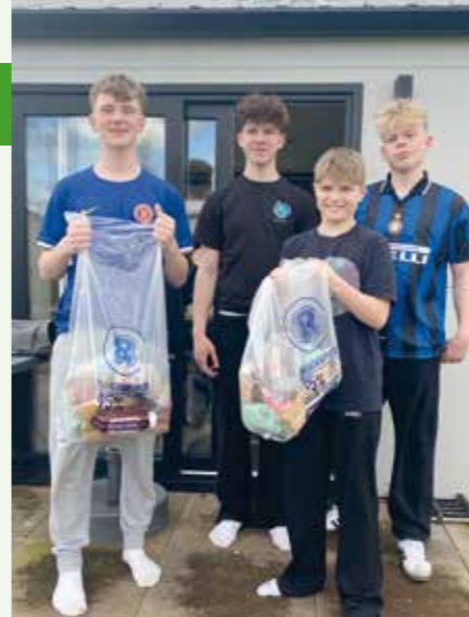
A – Rema 1000 i Vinding havde velvilligt bidraget med toastbrød, havregryn og pasta til sultne drenge, der kan tømme et køleskab på alle tidspunkter af døgnet.